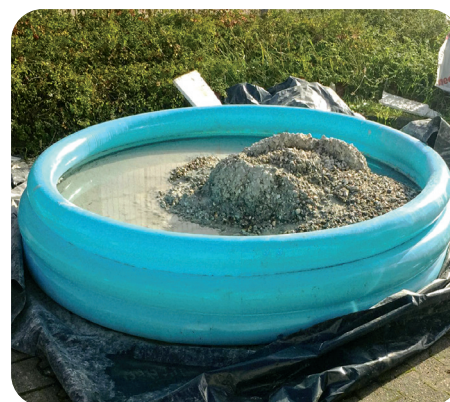
Waschplatz und Zwischenlagerung von Restbeton