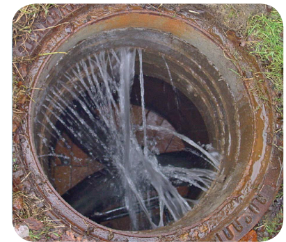
Grundwassereintritt im undichten Kanalschacht.